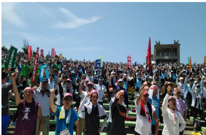
最終日の県民大会による平和を祈念した団結ガンバロー