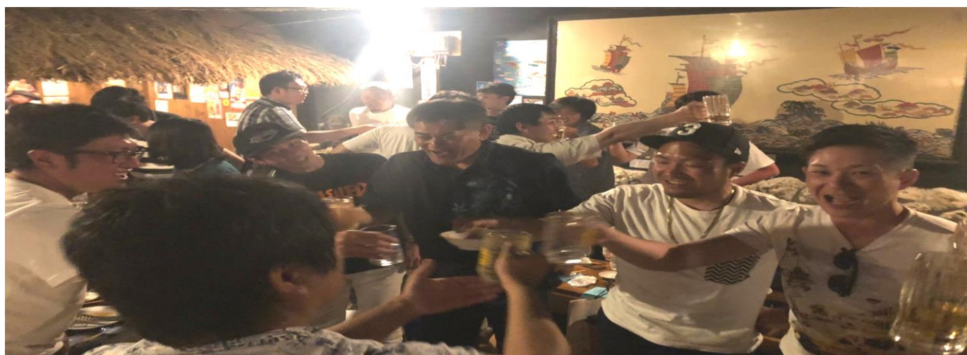
JR 東労組と浦添市職員との交流会も楽シ～サ～！