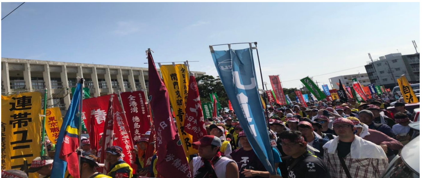
平和行進のために全国から参加しにきた仲間達