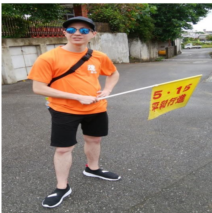
初レンジャーでテンションアゲアゲ