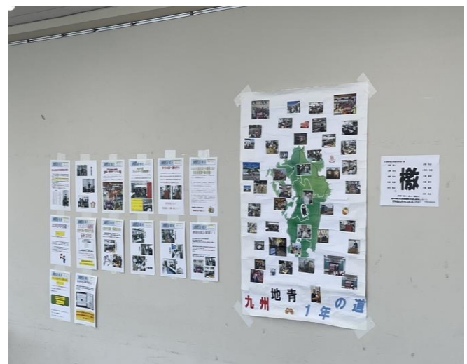
一年間の地青情報（左）