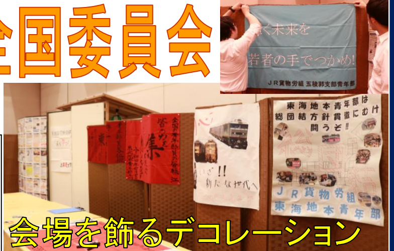
会場を飾るデコレーション