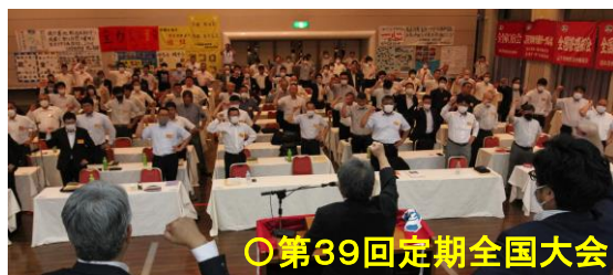
○第39回定期全国大会

また、秋の闘いの期間において「中央本部総対話行動」を展開し、組合員の声や生活の実態を把握し交渉に活かす取り組みも行なっていきます。全ての闘いをコロナ禍前の運動に戻し、分会活動のさらなる強化を通じて組織の一体感をかちとりましょう！