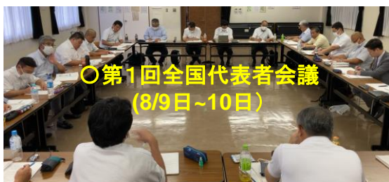
○第1回全国代表者会議 (8/9日~10日)