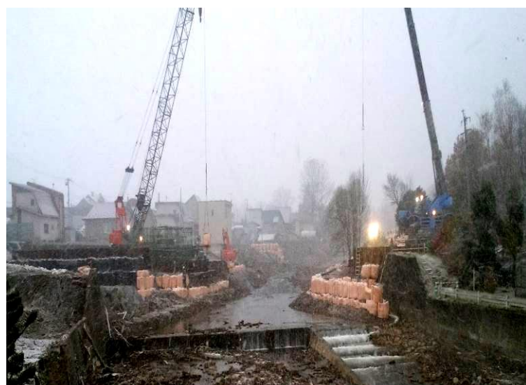
JR石勝・根室線の不通現場 開通は12月中を見込んでいる