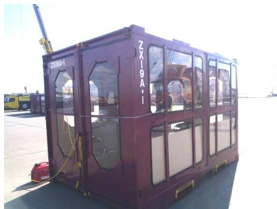
釧路港に設置した臨時「事務所」

8月に北海道に上陸した台風被害で現在もJR石勝・根室線が不通となっている為、札幌機関区帯広派出の乗務員は本来業務とは全く異なる釧路港でのコンテナ積み込みの慣れないサポート業務に奮闘しています！