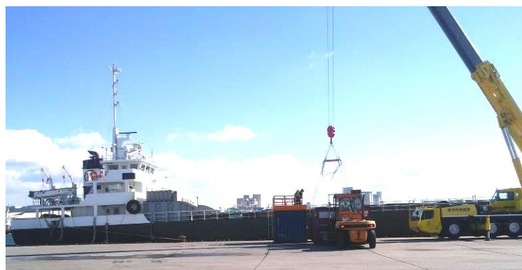
コンテナをフェリーに積み込む様子

青年部では現在、帯広支部青年部に対しての全国からの檄行動を展開していますが、より一層の檄で慣れない業務をこなしている帯広支部青年部員を全国から支えていこう！！