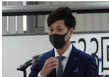
本部青年部池尻事務長