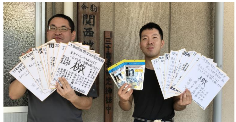
<東北地本より頂いた檄色紙>