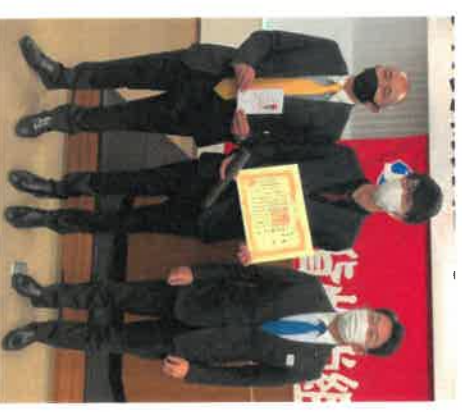
＜岡山（タ）分会は社長賞受賞！＞