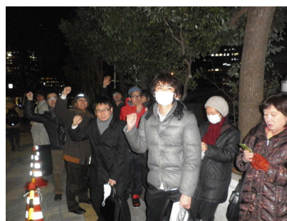
↑ 参加した青年部員と共に