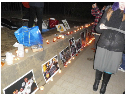
↑ 官邸前に行く途中にて